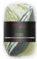
Farbe Nr. 86