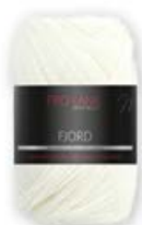
Farbe Nr. 80

70% Schurwolle Merino 30% Polyacryl Lauflänge 350m/100g Nadelstärke 5,5 – 6,5