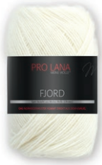
Farbe Nr. 80

70% Schurwolle Merino 30% Polyacryl Lauflänge 350m/100g Nadelstärke 5,5 – 6,5