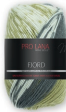
Farbe Nr. 86