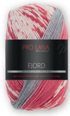
Farbe Nr. 83