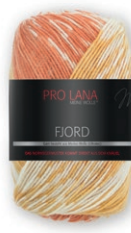
Farbe Nr. 82