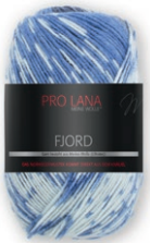
Farbe Nr. 84