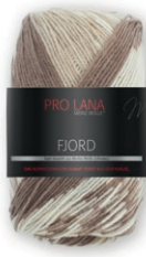
Farbe Nr. 81