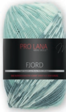
Farbe Nr. 85